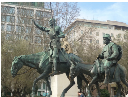
Don Quijote i Sancho Panza