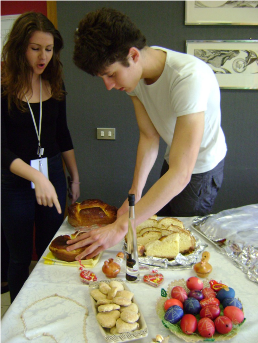
Naši su učenici predstavili uskrsne običaje u Hrvatskoj. Sa sobom su ponijeli uskrsna jaja te tradicionalne uskrsne kolače.