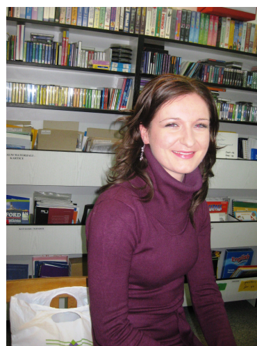
- engleski jezik