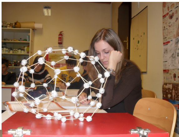
Uh, ta kemija!