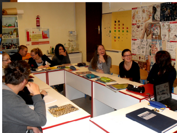
Nije uvijek sve ni tako ozbiljno

Tko su naši profesori? Pogledajmo neke od njih. Slika govori više od riječi.