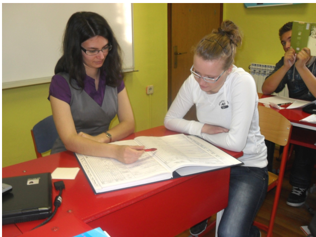
Analiza stanja i dogovor o daljnjoj strategiji učenja na satu mentorstva