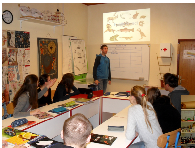
Ponekad učenici sami drže prezentacije za kolegice i kolege iz razreda