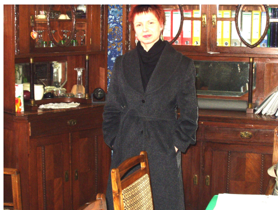
-hrvatski jezik i filmska umjetnost

Tko su naši profesori? Pogledajmo neke od njih. Slika govori više od riječi.